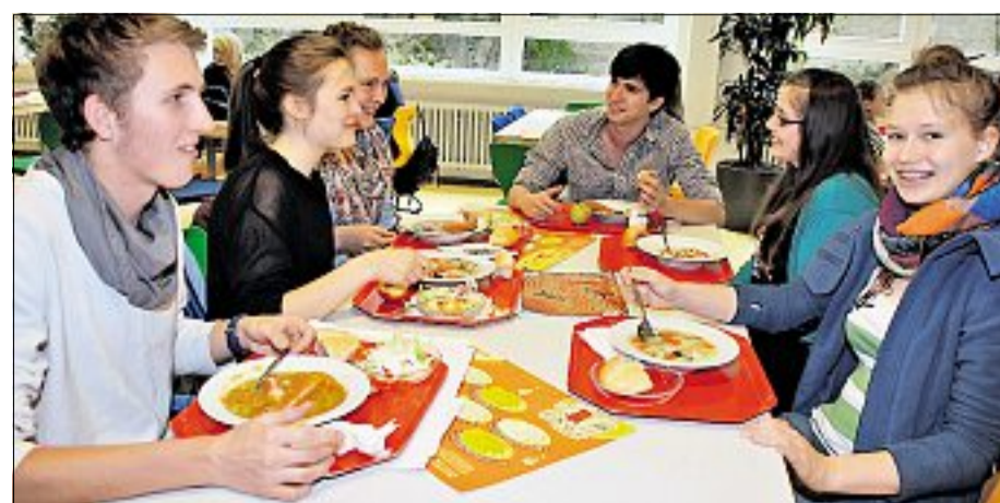
Schüler der RBG lassen es sich in der Mensa schmecken.