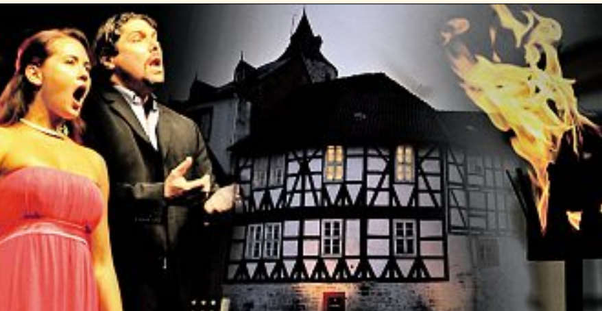
Einmalige Kulisse: Das „1. Sommer-Proms“ findet auf Schloss Oelber statt.